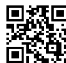
ライブスコアQRコード