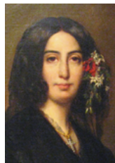
George Sand (1804-1876)

Aristocrate, poète, il est député dès 1833. Il joue un rôle majeur dans la révolution de février 1848, imposant le drapeau tricolore et devenant Ministre des affaires étrangères. Mais il est dépassé par les événements de juin et est battu aux élections présidentielles de 1848. Il se retire de la vie politique après le coup d'État de 1851.