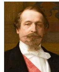
Louis Napoléon Bonaparte (1808-1873)

Mariée à un baron, elle devient une femme indépendante dans les années 1830. Amie de nombreux artistes romantiques (Chopin, Musset), elle écrit des romans et est aussi proche des milieux socialistes dont elle soutient la révolution de 1848. Sous le Second Empire, elle se consacre à son œuvre littéraire et à sa correspondance.