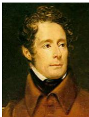
Alphonse de Lamartine (1790-1869)

Aristocrate, poète, il est député dès 1833. Il joue un rôle majeur dans la révolution de février 1848, imposant le drapeau tricolore et devenant Ministre des affaires étrangères. Mais il est dépassé par les événements de juin et est battu aux élections présidentielles de 1848. Il se retire de la vie politique après le coup d'État de 1851.