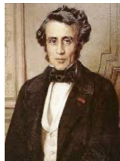
Émile Pereire (1800-1875)

Haut fonctionnaire, il est renvoyé sous la Deuxième République avant d'être réintégré sous le Second Empire. Il est nommé préfet de la Seine en 1853 et est chargé de mener des travaux pour réaménager la capitale. Il est fait baron en 1857. Il est renvoyé par Émile Ollivier en 1870 et fait l'objet de nombreuses critiques les républicains.