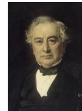
Isaac Pereire (1806-1880)

Fils d'un couple de bourgeois juifs bordelais, il monte à Paris en 1833 et devient couturier d'affaires. Dès 1835, il obtient avec son frère Isaac la concession de plusieurs lignes de chemin de fer. Il fonde aussi le Crédit mobilier en 1857 qui finance en partie les travaux du baron Haussmann à Paris et il élu député en 1863. En 1869, il ne se représente pas.