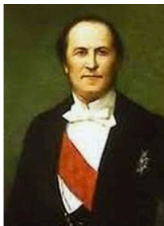
Georges Haussmann (1809-1891)

Haut fonctionnaire, il est renvoyé sous la Deuxième République avant d'être réintégré sous le Second Empire. Il est nommé préfet de la Seine en 1853 et est chargé de mener des travaux pour réaménager la capitale. Il est fait baron en 1857. Il est renvoyé par Émile Ollivier en 1870 et fait l'objet de nombreuses critiques les républicains.