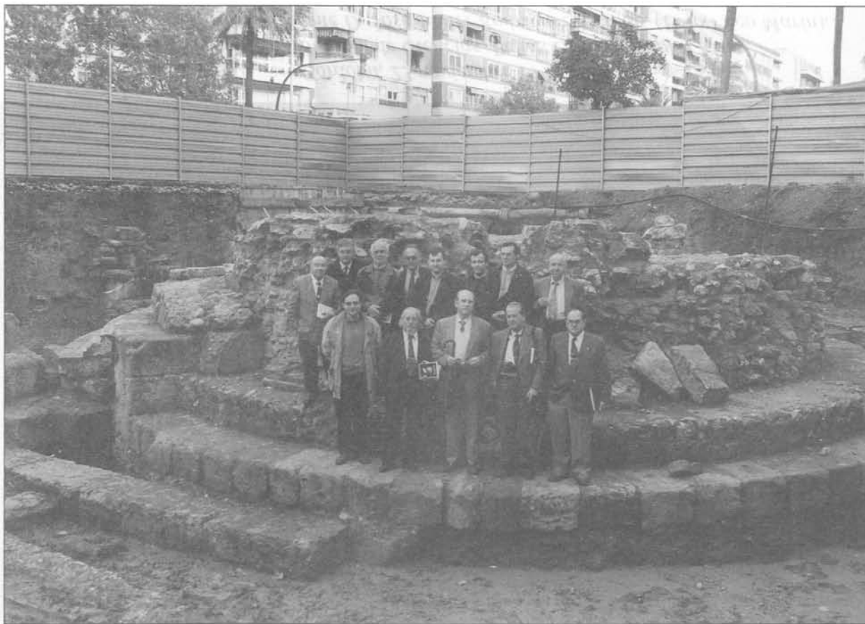
Córdoba, 30 noviembre 1995. Real Academia de Córdoba. Visita corporativa de un grupo de Académicos al yacimiento arqueológico romano junto a la Puerta de Gallegos, de Córdoba. (Fotografía Framar).