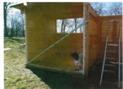
Das neue Holzhaus wird inspiziert.

Auf diesem Gelände konnten wir auch unsere ganz scheuen Katzen, die wir mit der Falle eingefangen haben und die sich niemals werden anfassen lassen, optimal unterbringen. Wir haben ihre Bettchen unter den Holzbedachungen des Heu- und Strohlagers neben dem Hühner- und Entenstall zwischen den Ballen mit warmen Decken ausgelegt.