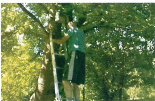
Nisthilfen werden gerne angenommen.

Im Spätsommer besuchten uns Fledermäuse und in einem der aufgehängten Vogelhäuschen an einer Holzhütte ist bereits eine Haselmaus eingezogen.