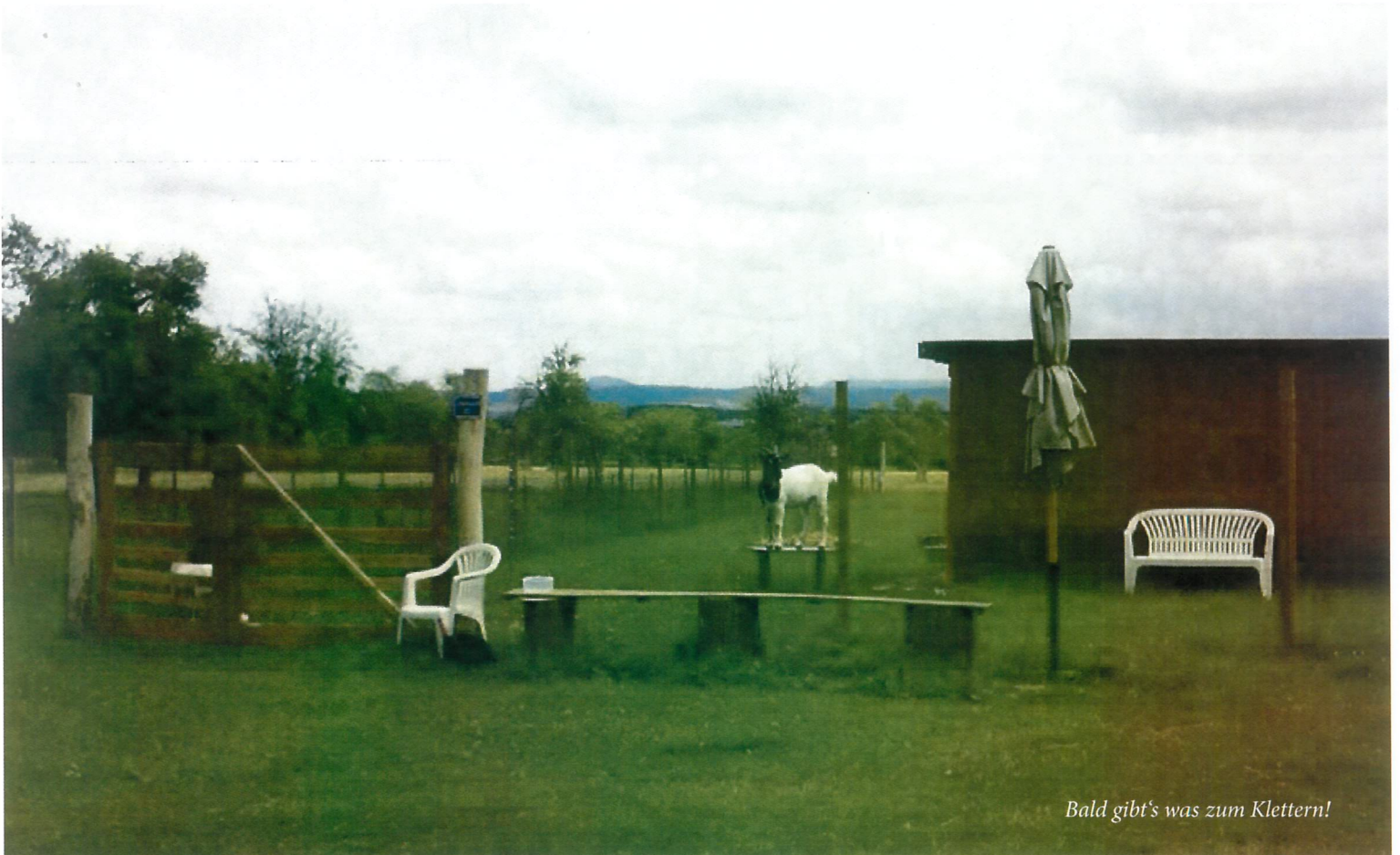
Bald gibt's was zum Klettern!

Für unsere Ziegen konnten wir im Frühjahr ein schönes Holzhaus mit zusätzlicher Überdachung erwerben und der Zaun ihres Auslaufs wurde uns auch zum großen Teil gespendet. Erst kürzlich wurde jetzt noch ein geeignetes Dach und eine Regenrinne angebracht, um auch für Trinkwasser der Tiere auf dem Gelände zu sorgen.