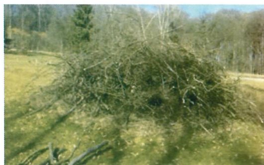
Gestrüpphaufen dienen vielen Tieren als Unterschlupf.