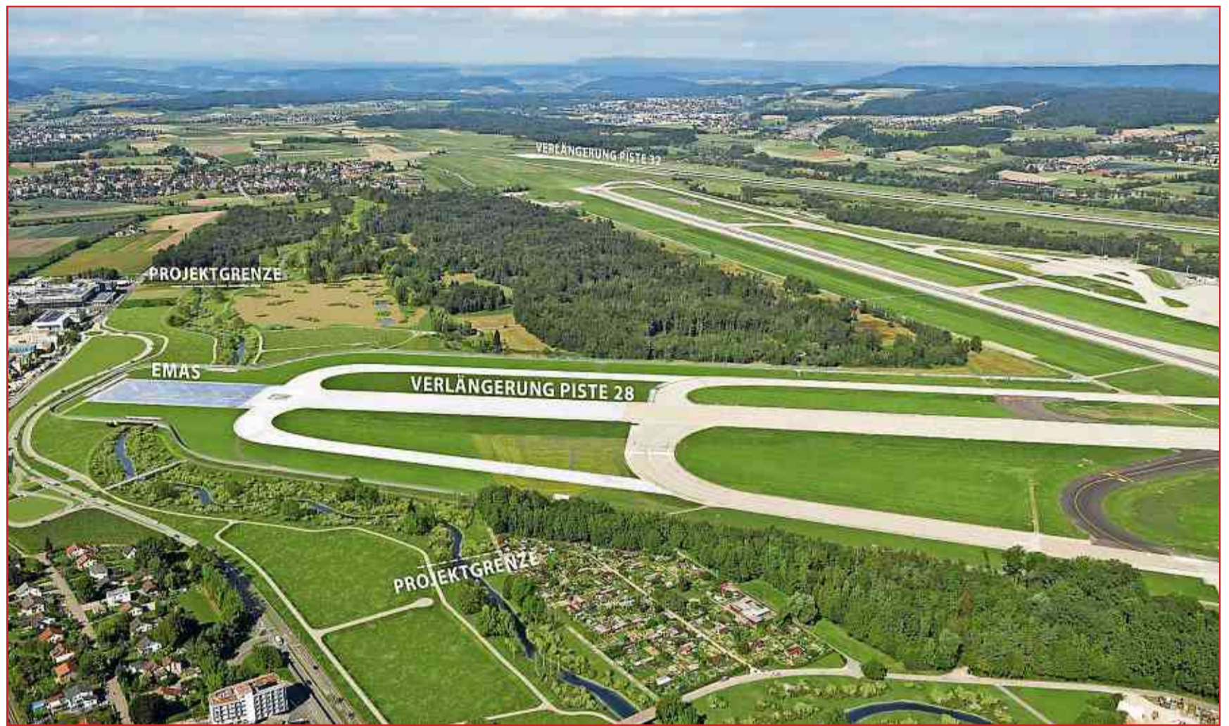
Die geplanten Verlängerungen der Pisten 28 und 32. Visualisierung: Flughafen Zürich AG

Heute arbeitet der Flughafen Zürich mit drei Betriebskonzepten: einem Nord-, einem Ost- und einem Südkonzept. Je nachdem sind stündlich zwischen 50 und 66 Flugbewegungen möglich. Die Konzepte sind eine Folge von politischen und aviatischen Rahmenbe-