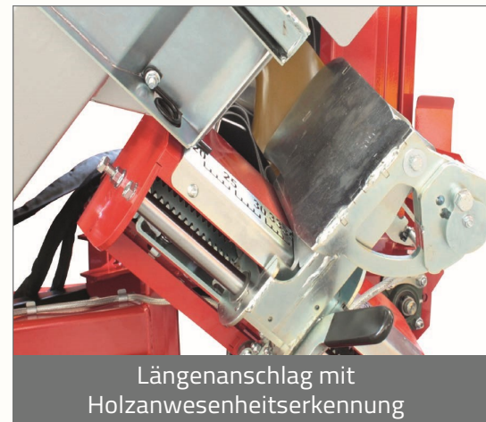
Längenanschlag mit Holzanwesenheitserkennung