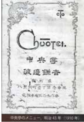
中央亭のメニュー、明治 43 年（1910 年）