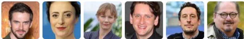
Dan Stevens Tom Maren Eggert Sandra Hüller Employee Sebastian Schwarz Police Officer Hans Löw Julian Jürgen Tarrach Dr Stuber