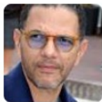
Roschdy Zem Philippe - le capi...