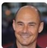
Bernard Campan Philippe