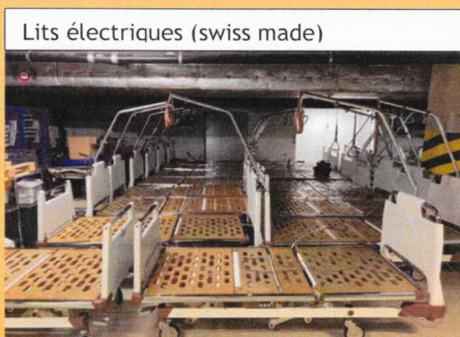
Lits électriques (swiss made)

Don de 40 lits (état de neuf) de Clinique Cecil de Lausanne (Groupe Hirslanden) pour le plus grand centre de pneumologie du Népal, en phase finale de construction.