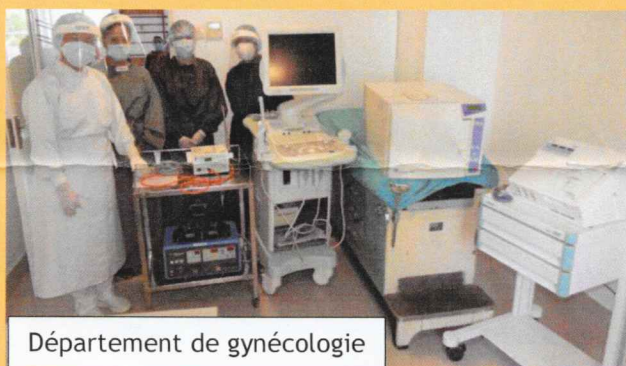
Département de gynécologie

Appareil CTG (cardiotocographie) pour le contrôle cardiaque de la mère et du bébé