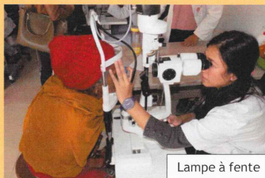
Lampe à fente

OCT *, lampes à fente, réfractomètres, pachymètres, tonomètres, camera pour fond de l'oeil ....) (*) Un OCT - Optical Cohérence Tomographie - est un scanner pour les yeux qui détecte les pathologies de la cornée et de la rétine (glaucome, problèmes cornéens, maladies rétinienne)