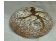
ライ麦60、しっとりライ麦(フレーン)