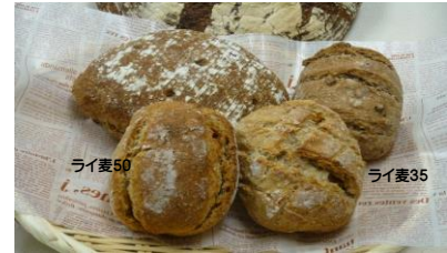
ライ麦パン各種: ライ麦35、ライ麦50

■ライ麦パンは、カレンスで酵母を起し、オーガニックライ麦と東北の小麦'ゆきちから'を使い高温で焼いています。そのため表面が堅くなりますが、中は大きく焼くほどもちり、ふんわりになります。ライ麦のさわやかな酸味、芳香を楽しむために、チーズ類などを塗って、生ハム、ソーセージをのせカナッペやサンドイッチにして召し上がりください。