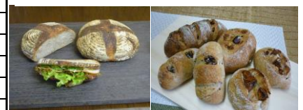
カンパーニュ、フレーン くるみパン、くるみパンいちじく

■カンパーニュは北海道小麦をベースに東北産ゆきちからと少量のライ麦を自家製酵母を使いじっくり発酵させ高温で焼きました。皮は厚めで香ばしく歯ごたえがあり、中はしっとりとして酵母のほのかな酸味があります。国産小麦と自家製酵母の香りをお楽しみください。