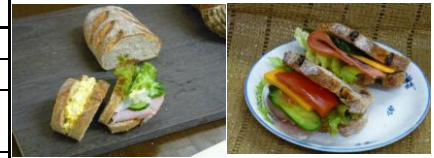
ソフトライ麦、フレーン ソフトライ麦 生くるみレーズン