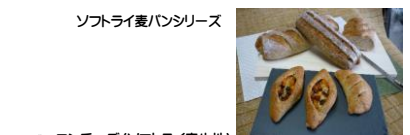
ソフトライ麦ハンズシリーズ