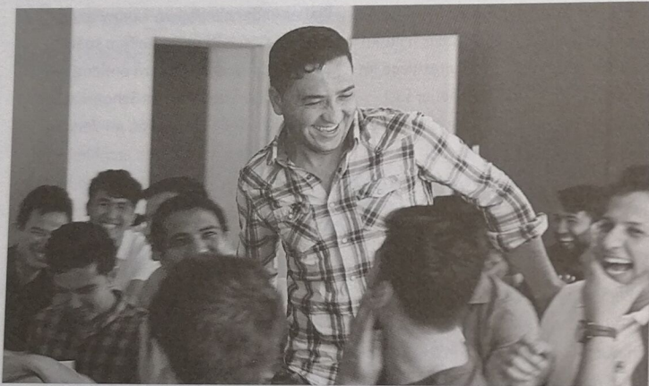
Mit unserer Arbeit wollen wir dazu beitragen, dass diese jungen Menschen gemäß ihrer Fähigkeiten und Begabungen gefördert werden und ihren Weg finden.

Wir finden gerade deshalb stellen sie eine Bereicherung für jedes Unternehmen dar. Mit unserer Arbeit wollen wir dazu beitragen, dass diese jungen Menschen gemäß ihrer Fähigkeiten und Begabungen gefördert werden und ihren Weg finden. Wir werden dabei von einigen Unternehmen, vor allem mit Schnuppertagen, Praktika, Workshops und natürlich auch mit Lehrstellen, unterstützt. Daher haben wir