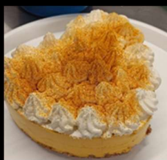
Cheesecake alla zucca