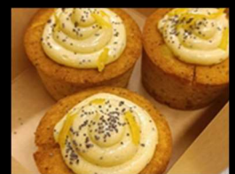
Muffins al limone