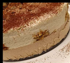
Cheesecake al tiramisù