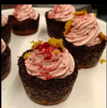
Red Velvet Muffins

TUTTI i nostri dolci sono VEGANI, SENZA GLUTINE e „zuccherati“ solo con sciroppo di fiori di cocco, zuccherio di fiori di coco oppure xilitolo (adatto anche per diabetici)