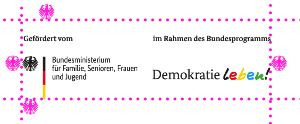
Illustration: Schutzraum um das Logo