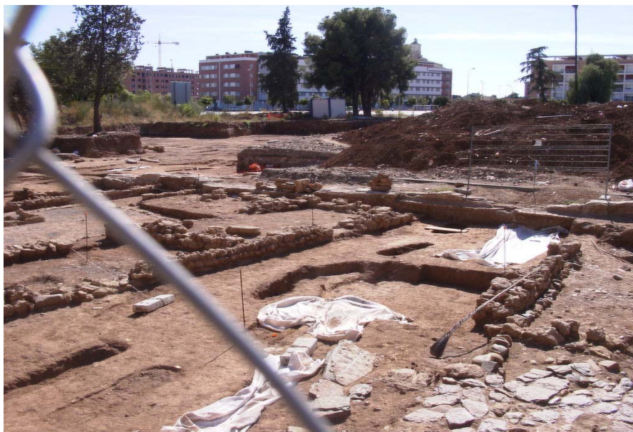
Obsérvese como los restos de construcciones están sobre las tumbas