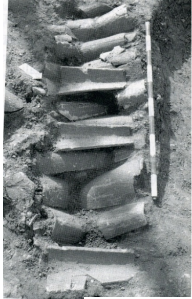
Un tumba cubierta de tejas, una tradición heredada del mundo hispanoromano.

Esto indica que la arabización e islamización de Córdoba fue rápida, no respetándose ni conventos ni iglesias ante la rápida conversión al Islam de los primitivos habitantes de Córdoba y sobre todo por el establecimiento de familias árabes y bereberes venidas de fuera de al-Andalus. Estos arrabales occidentales no respetaron en su rápido crecimiento las propiedades cristianas, llegando a construir a veces encima de las tumbas.