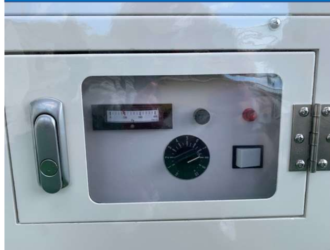
操作パネル部(防水仕様)