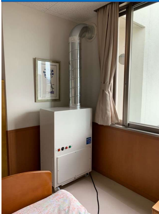
室内設置状況①(壁貫通)