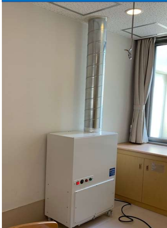
室内設置状況②(天井貫通)