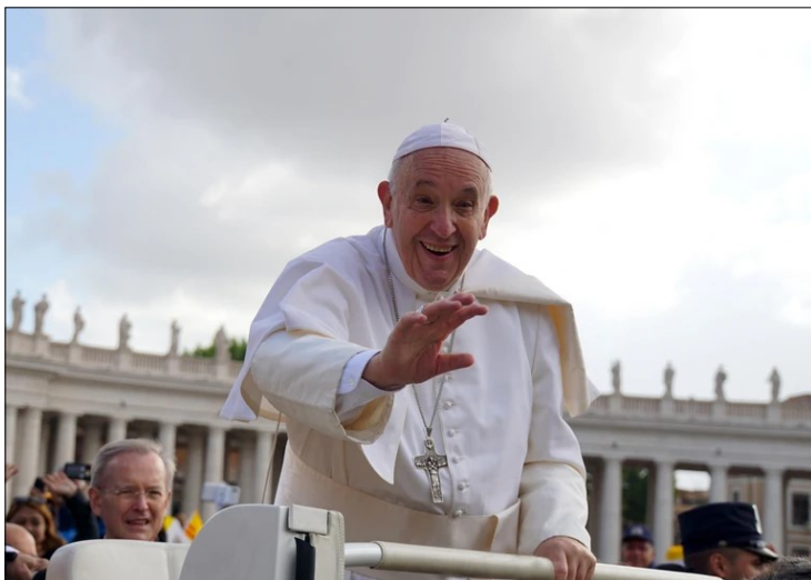
Papst Franziskus

Am 9. Mai 2024 hat Papst Franziskus mit seinem Schreiben Spes non confundit (Die Hoffnung lässt nicht zugrunde gehen) das Heilige Jahr 2025 offiziell einberufen. Der Text kann als Schlüssel zum Verständnis des Papstes zum Heiligen Jahr verstanden werden. Franziskus hat bereits vor längerer Zeit das Heilige Jahr 2025 unter das Motto "Pilger der Hoffnung" gestellt und will damit deutlich machen, wie dringend notwendig die Hoffnung in einer Welt von Gewalt, Hass und Kriegen ist.