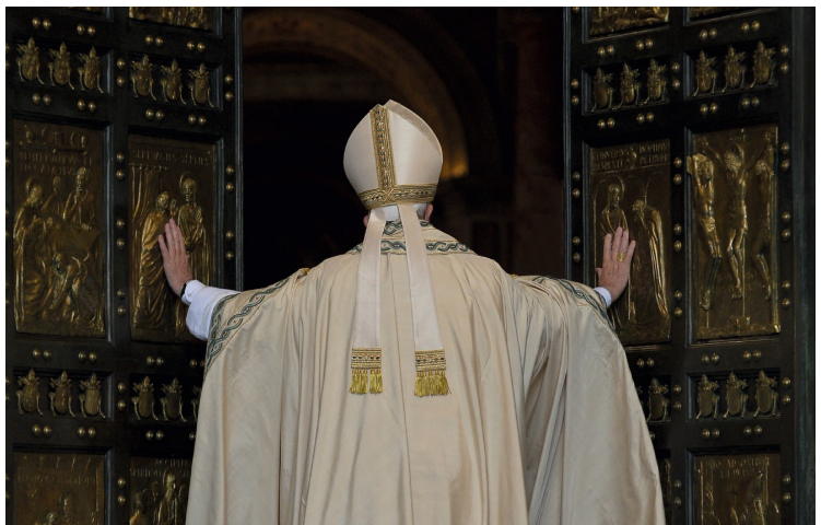
Bild: Papst Franziskus beim Öffnen der Heiligen Pforte 2015 (pfarrbrief.de)

Unter dem Motto „Pilger der Hoffnung“ wird der Papst das Heilige Jahr 2025 offiziell am 24. Dezember 2024 eröffnen. In einer eigenen Zeremonie wird dann Franziskus die Heilige Pforte am Petersdom öffnen, die wieder am 6. Januar 2026 geschlossen wird. Wer als Pilger diese Pforte in diesem Zeitraum durchschreitet, kann einen Ablass empfangen und so ein besonderes Zeichen der Versöhnung mit Gott setzen.