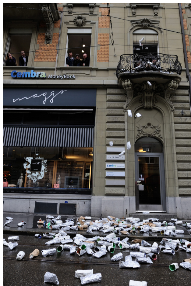
MISSING ICONS «DAS WESEN DER VERPACKUNG» (FEBRUAR / MÄRZ 2016)