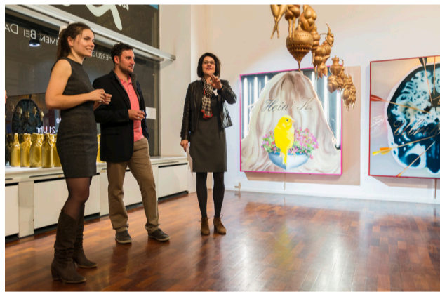
POP-UP GALERIE IM EHEMALIGEN ANLIKERHAUS, BUBENBERGPLATZ 15, BERN (AUGUST 2012)