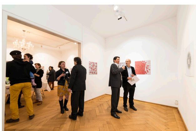
GALERIE-RÄUMLICHKEITEN AM BUBENBERGPLATZ 15 IM 1. OG, IM CONCEPT-STORE MAGGS, LOEB AG (FEBRUAR 2013)