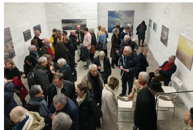
MARTIN ZIEGELMÜLLER «NEUE WERKE» (MÄRZ / APRIL 2019)