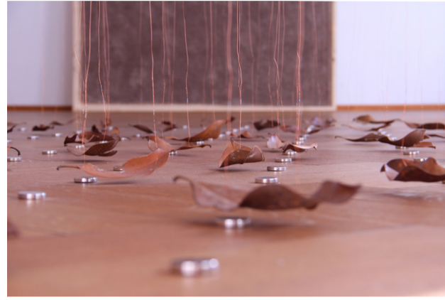
SALOMÉ BÄUMLIN UND RUDY DECELIÈRE «SILENCE ON THE FLOOR» (JANUAR / MÄRZ 2015)