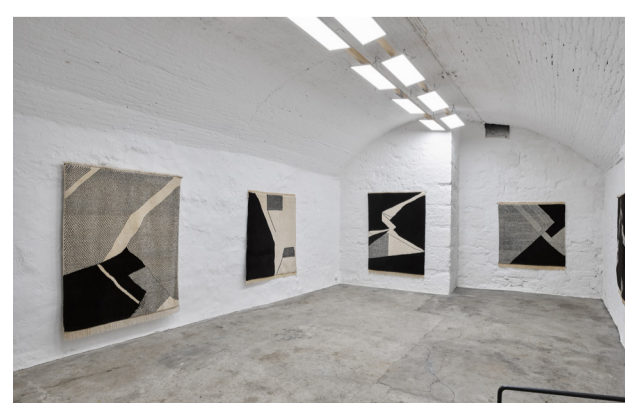
ETEL ADNAN, SALOMÉ BÄUMLIN «UND DU DENKST, DIE LIEBE SEI WEISS» (MAI / JUNI 2019)