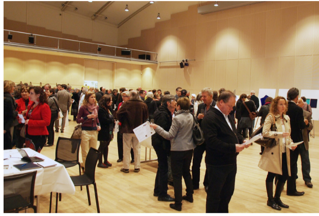
«COLLECTION PRESENTATION» IM ZENTRUM PAUL KLEE (21. APRIL 2012)