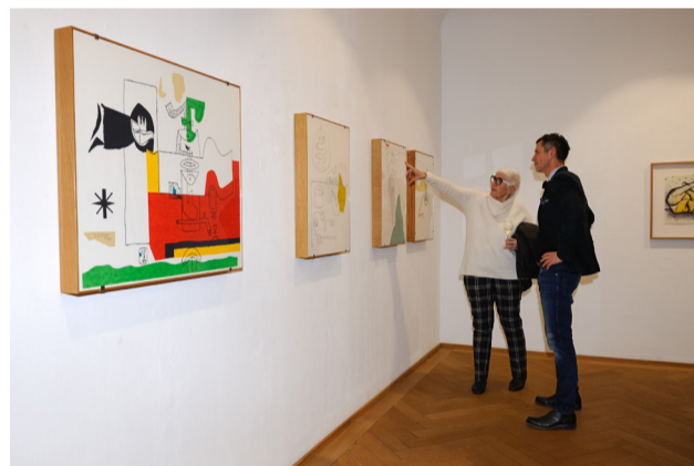
RENÉ BURRI UND LE CORBUSIER «IM ZENTRUM DER MENSCH» (JANUAR FEBRUAR 2016)