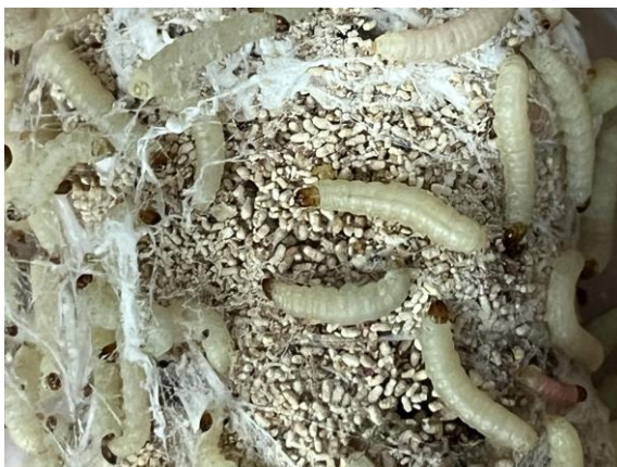
Larven der Dörrobstmotte fressen an Mehlprodukten, Trockenfrüchten, Nüssen, Kakaoprodukten und Tierfutter

Es gibt sehr viele heimische und auch eingeschleppte Arten. Eine Diagnose ist nicht immer ganz einfach. Wertvolle Informationen zur Bestimmung und Bekämpfung finden Sie unter: ✓ Schädlingsbekämpfung Privatkunden | Biologische Beratung (biologische-beratung.de)