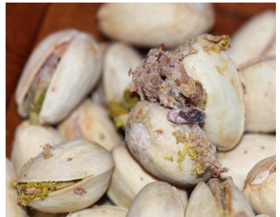
Verspinnene Ausscheidungen von Raupen der Dörrobstmotte auf Pistazien

Aus der Küche ist die Dörrobstmotte bekannt, die als kleiner Schmetterling (8 mm) durchaus im Küchenbereich herumflattert und bis zu 400 Eier an diversen Nahrungsmitteln wie Gewürzen, Backzutaten, Trockenobst, Nüssen, Schokolade, Müslis, Nudeln, Brot- und Gebäckkrümeln und Tierfutter ablegen kann.