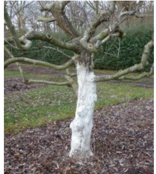
Weißanstrich am Apfel

Stauden, die im späten Herbst gepflanzt wurden, können bei Bodenfrosthochfrieren, d.h. ihr Ballen guckt ein wenig aus dem Boden heraus, wenn sie noch nicht genug neue Wurzeln im Erdreich bilden konnten. Bei frostfreiem Boden Pflanzhöhe jetzt korrigieren.