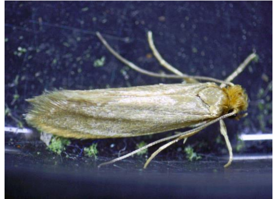
Pelzmotte, deren Larven Textilien schädigen

Info: https://www.berlin.de/pflanzenschutzamt/assets/service/merkblaetter-ratgeber-und-broschue- ren/wohnungsschaedlinge.pdf?ts=1705017661