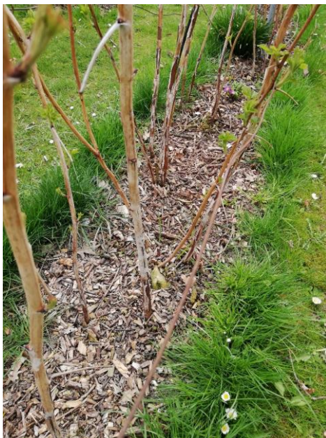
Himbeeren mit Holzhäcksel aus Schnittgut

Bäume und Sträucher bereiten sich bei milden Februartemperaturen auf den Austrieb vor. Bei Ziergehölzen ist eine vorzeitige Blüte durchaus tolerierbar. Bei Obstgehölzen birgt eine frühe Blüte aber die Gefahr, Frostschäden zu erleiden. Auch wäre eine ausreichende Bestäubung durch (Wild-)Bienen noch nicht gegeben.