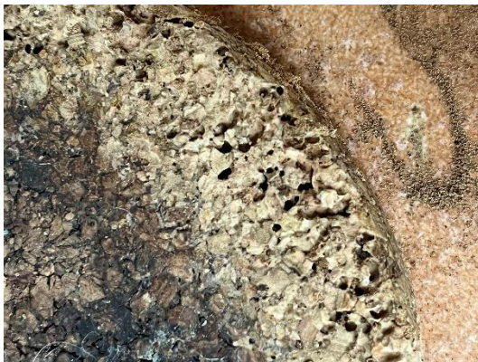
Korkuntersetzer durchfressen von Käferlarven