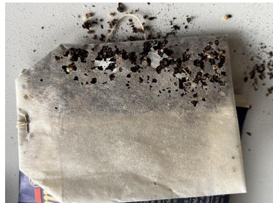
Teebeutel durch Larvenfraß von Vorrats- schädlingen zerstört und unbrauchbar