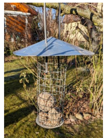
netzfreies Meisenknödel- angebot

Auch bei frostfreiem Wetter sollte die Winterfütterung nicht eingestellt werden. Ohne Insektenangebot ist der Bedarf an Nüssen, Kernen und Fett sehr hoch. Um zu vermeiden, dass Kunststoff für den Nestbau verwendet wird, sollten z.B. Meisenknödel aus den Netzen genommen werden und im Garten kein ausgefranstes Bändchengewebe offen liegen, damit sich die (Jung-)Vögel nicht darin verheddern.