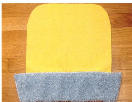
RECHTS: Der Trailermopp (re.) wurde einem Vergleichstest unterzogen.