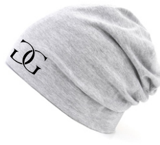
heather light grey