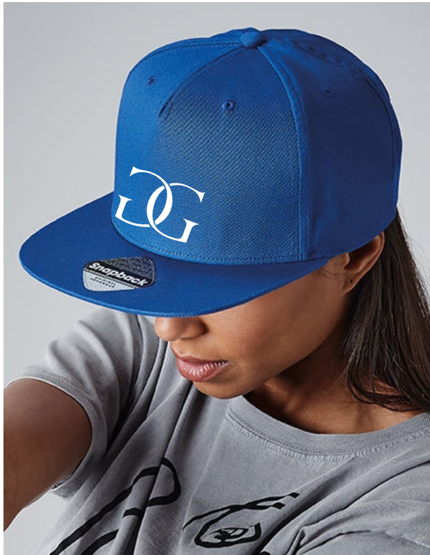
Farbe: bright royal