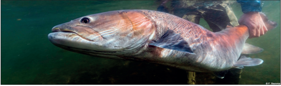
Abb. 2: Huchen ( Hucho hucho ) © F. Steinmann. Fig. 2: Danube Salmon ( Hucho hucho ) © F. Steinmann.

lichen Donaueinzugsgebiet kommt diese Art heute nur mehr in Restbeständen vor. Als Endglied der Nahrungspyramide stellt der Huchen einen idealen Indikator für den Zustand der Gewässer dar. Zu den Hauptursachen für den anhaltenden Rückgang der Huchen-Bestände zählen: der Ausbau der Wasserkraft, Flussregulierungen, der Klimawandel sowie steigende Populationen von Fischfressern wie Fischotter, Gänsesäger und Kormoran und vor allem die kumulative Wirkung dieser Faktoren.