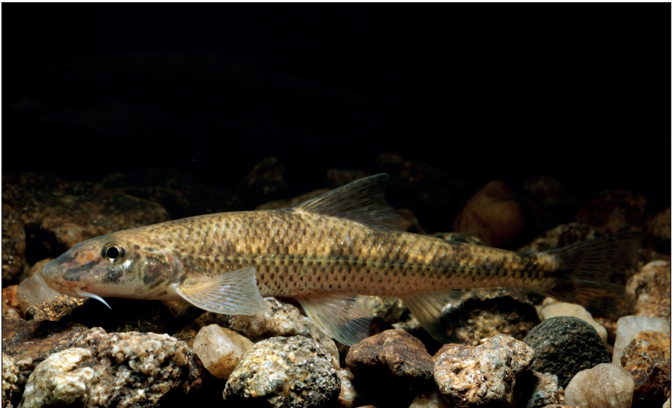
Abb. 3: Adulter Smaragdgressling ( Romanogobio skywalker ). © Clemens Ratschan – Fig. 3: Adult emerald gudgeon ( Romanogobio skywalker ). © Clemens Ratschan.

(Ratschan et al. 2021). Gründlinge der Gattung Gobio sind in Österreich laut Roter Liste (Wolfram & Miksch 2007) mit einer Art, dem Gründling, G. gobio (Linnaeus, 1758), bzw. laut Kottelat & Freyhof (2007), mit zwei Arten, G. gobio im Nordwesten und dem Donau-Gründling, G. obtusirostris (Valenciennes, 1842), im Osten und Süden, mit einer potentiellen Hybridzone in der Oberen Donau, vertreten. Tatsächlich stellt sich die Situation viel komplexer dar, mit einer natürlichen, durch nacheiszeitliche Kolonisierungsprozesse bedingten Hybridzone, die zumindest die gesamte Osthälfte Österreichs umfasst und nicht nur Gründling und Donau-Gründling beherbergt, sondern auch eine dritte, noch unbeschriebene Art bzw. divergente genetische Linie, die nah verwandt ist zu einigen am Balkan vorkommenden Arten (Zangl et al. 2020). Die exakten Verbreitungsgrenzen der einzelnen Arten / Linien sind noch nicht bekannt.