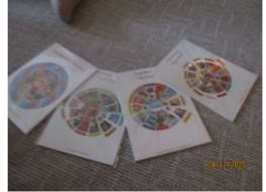
Eine neue Magnettafel für die Garderobe mit Karten zu den Themen Jahreszeiten, Wochentage und Wetter.