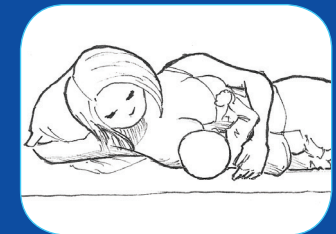
Allongée sur le côté