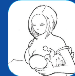
Ballon de rugby