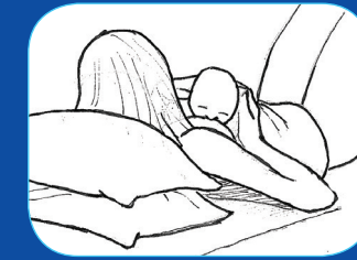
Bain de soleil

Vous pouvez varier la position du bébé pour les tétées, notamment en cas de douleurs (crevasses, mastite...).