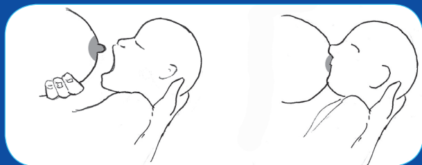
Mise au sein

Quelle que soit la position, le bon repère est que le mamelon soit en face du nez à la prise du sein et que la tête du bébé soit légèrement basculée en arrière.