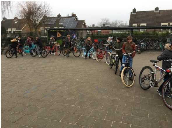
De leerlingen van groep 6 tijdens de controle.

en Sagal bereid om de controle uit te voeren. Dank daarvoor! Bij 90 leerlingen was de fiets helemaal in orde was. Zij kregen een stickerkaart. Bij 14 leerlingen was de verlichting niet in orde. We gaan er van uit, dat de ouders van de leerlingen bij wie de fiets niet in orde is, maatregelen nemen om ervoor te zorgen dat hun kind op een verkeersveilige fiets kan rijden.