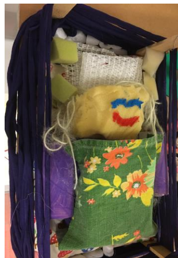
Het werkstuk van Suus gemaakt in het atelier beeldende vorming.