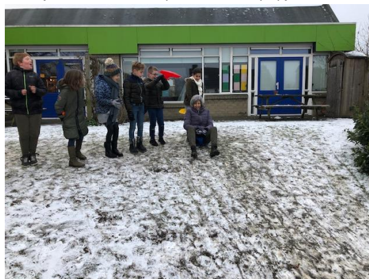
Ook de juf glijdt graag mee.