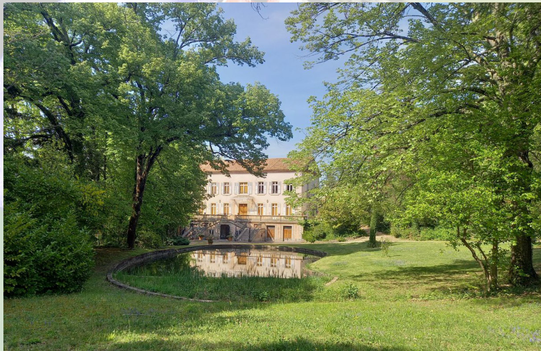
Château du Rouret, Domaine Pierre & Vacances, Grospierres