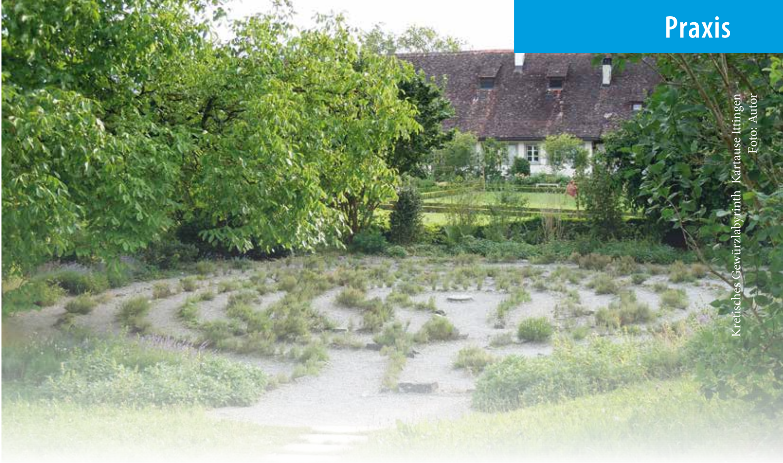
Kretisches Gewürzlabrynth Kartause Ittingen