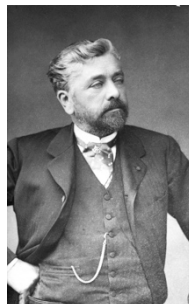
Gustave Eiffel (1832-1923)

Industriel issu d'une grande famille originaire du Creusot, il est à la tête de l'entreprise sidérurgique familiale. Il occupe aussi des fonctions à la Banque de France et des fonctions politiques (député-maire du Creusot). Dirigeant paternaliste, il institue un système de retraite pour les ouvriers de son entreprise.