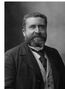
Jean Jaurès (1859-1914)

Né à Dijon, il entre à l'École centrale à Paris et devient dès lors l'un des plus grands ingénieurs et des plus grands industriels français de la fin du XIX ème siècle. Il travaille pour des compagnies de chemins de fer et construit des viaducs puis est retenu pour construire la Tour Eiffel mais aussi la Statue de la Liberté.