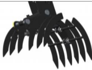
Multifunktion Gabel und Ausgleichsgewicht von 30 kg 15.) 690.--