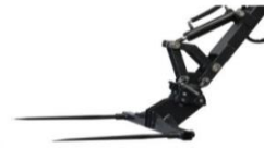
Ballenladegabel und Ausgleichsgewicht von 30 kg 9.) 615.--