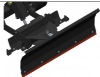
Schneepflug 19.) 575.--