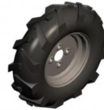
Satz 2 Räder mit Traktorreifen