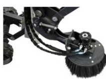
Radial Jätebürste 24.) 695.--