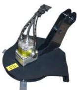
Freischneider 22.) 890.--