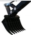
Klaue/Rechen 20.) 315.--