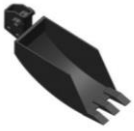
Grabenschaufel mit Zahn 16 cm 1.) 330.--