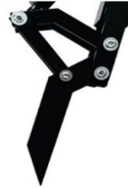
Aufreisszahn 12.) 190.--