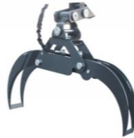
Holzgreifer 8.) 595.--