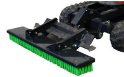
Frontbesen 17.) 595.--