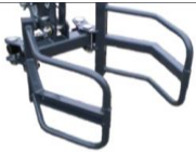
Ballengreifer und Ausgleichsgewicht von 30 kg 14.) 695.--