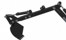
Verlängerung 40 cm 25.) 270.--