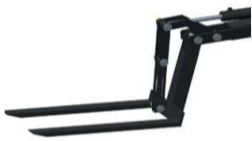
Ladegabel und Ausgleichsgewicht von 30 kg 10.) 485.--