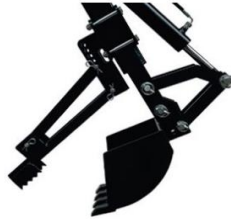
Baggerdaumen 11.) 295.--