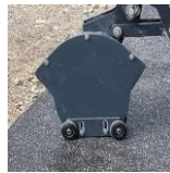
Dachpappenschneider mit Silikongleiträder