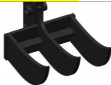
3 Zahnklaue 18.) 310.--