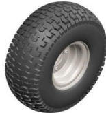
Satz 4 Golfräder