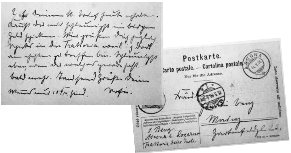
Postkarte aus Ascona vom 14.5.1906 mit Absender