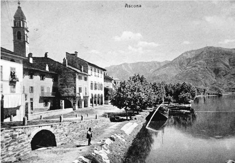
Ascona Anfang 1900 (Postkarte von 1908, Verl. Künzli-Tobler, Zürich, Privatarchiv P. B.)

Ascona hat etwa 1000 Einwohner; dazu kommen 50–100 Deutsche, [...] übermässig viele sind es noch nicht, die sich an der göttlichen Herrlichkeit dieser einzigen Landschaft erfreuen. Und wie schön diese Landschaft ist! In weitem Umkreise hohe dunkelgrüne Bergzüge, [...]. Mit Asconas Sehenswürdigkeiten möchte ich mich nicht lange aufhalten. [...] Viermal täglich im Sommer legt an Asconas Gestade ein schweizerisch-italienischer Dampfer an, [...] zweimal täglich klingelt die Post Locarno-Brissago [...], je viermal täglich hält hier ein Automobil-Omnibus [...], der auf der Hin- und Rücktour für einige Minuten die schöne Gegend mit Lärm und Gestank versieht. Dass die Chaussee daneben von Fahrrädern mit Pedal- und Motorbetrieb, von Mietskutschen und Privat-Autos wimmelt, dass einem angst und bange werden kann, versteht sich am Rande. 47