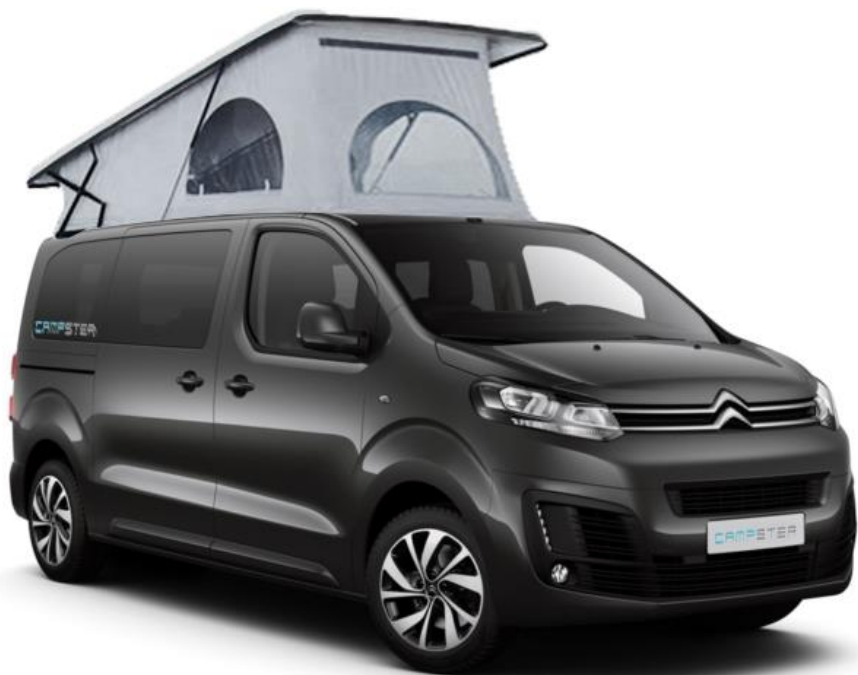
Abbildung Citroen Chassis

Irrtum, Preisänderung und Änderungen der technischen Angaben und Optionen sowie Änderung des Fertigstellungstermins vorbehalten