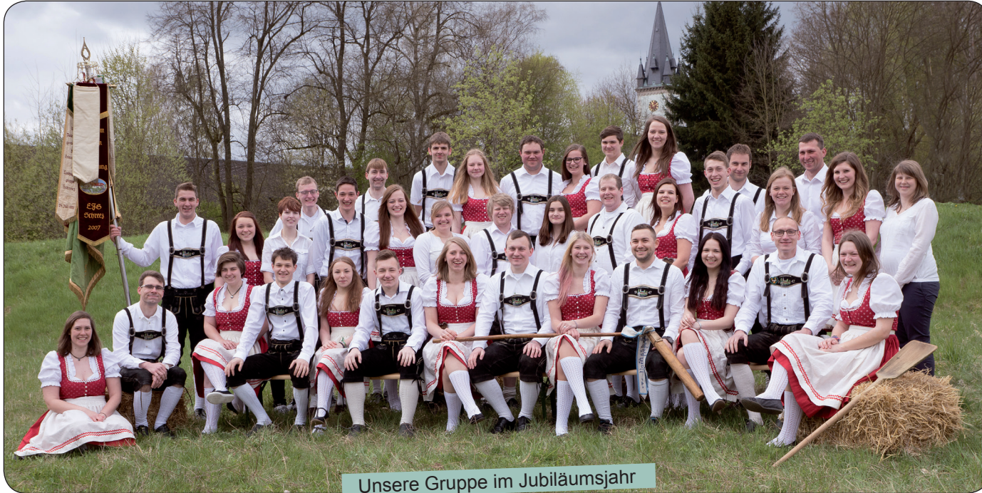
Unsere Gruppe im Jubiläumsjahr

Organisieren Teamwork Zusammenhalt Freundschaft Tradition Liebe Heimat gesellschaftliches Engagement Für einander und Miteinander Zusammenkommen Verantwortung