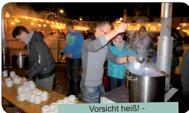
Vorsicht heiß! - Glühweinparty im Rathaushof