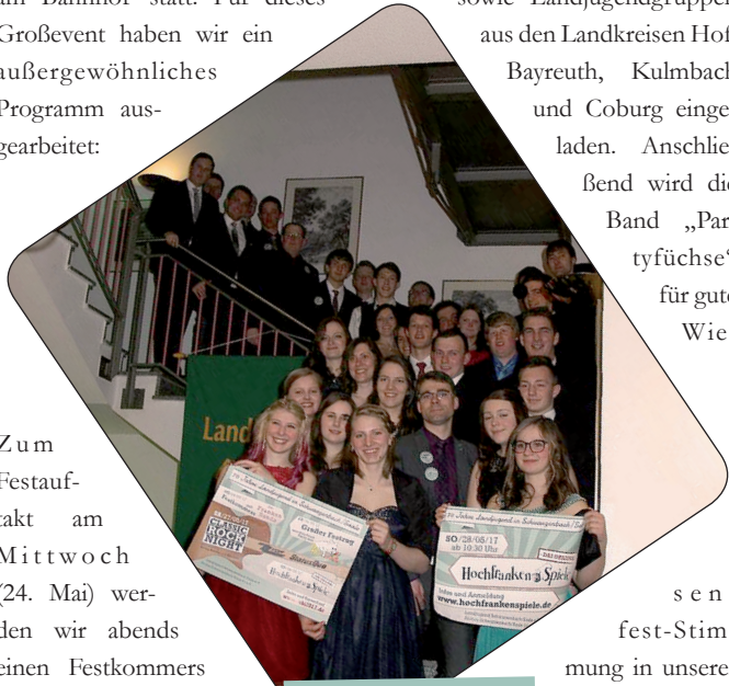
Hofer Bauernball 2017

fest-Stimmung in unserer Festhalle sorgen.