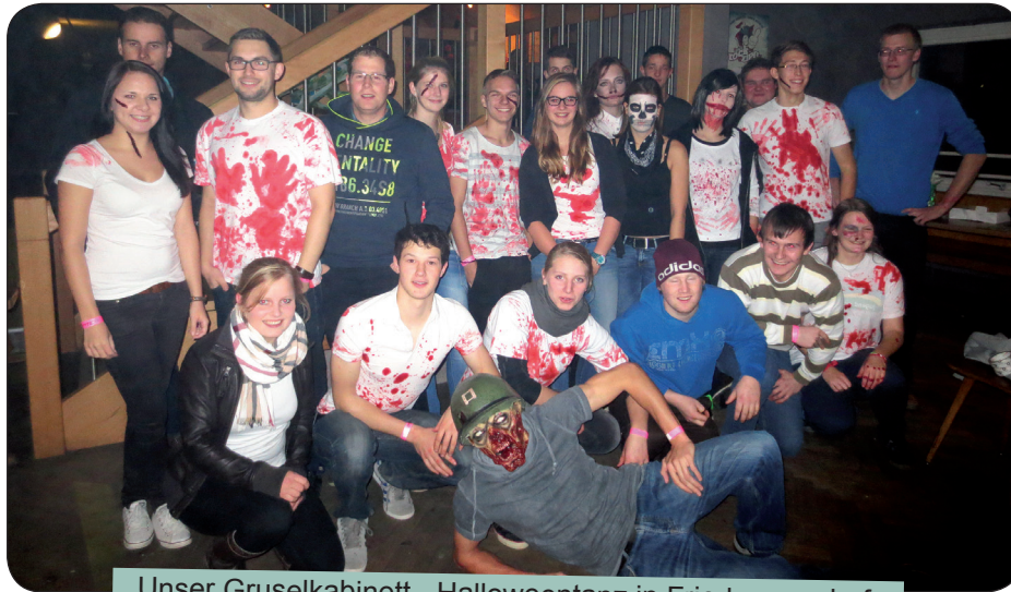
Unser Gruselkabinett - Halloweentanz in Friedmannsdorf

Wir als Landjugend veranstalten jährlich in eigener Verantwortung eine Halloweenparty. Diese findet traditionell am Abend vor dem Hochfest Allerheiligen, vom 31. Oktober auf den 01. November, statt. Dazu werden u.a. auch alle anderen Landjugendgruppen aus den umliegenden Landkreisen eingeladen. Der gegenseitige Besuch von Veranstaltungen der einzelnen Landjugendgruppen hat einen hohen Stellenwert in jedem Landjugendkalender.