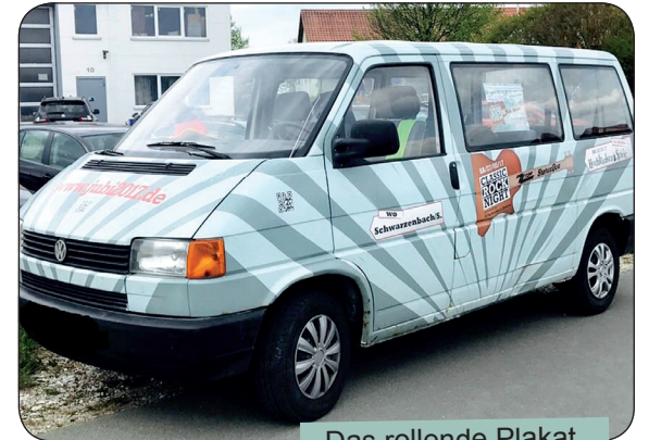
Das rollende Plakat

im Smoker gart. Als weiteres Highlight haben wir mit der Brauerei Meinel ein extra „Schwäzabächer Jubi-Bier“ eingebraut, welches das gesamte Wochenende bei uns genossen werden kann.