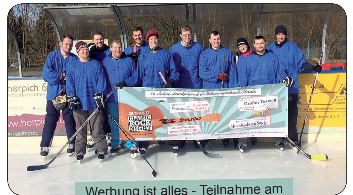
Werbung ist alles - Teilnahme am Bye-bye-Eisteich-Eishockeyturnier

WIR GRATULIEREN ZUM 70 JÄHRIGEN BESTEHEN UND WÜNSCHEN FÜR DIE ZUKUNFT ALLES GUTE!