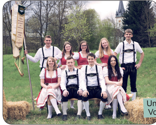
Unsere aktuelle Vorstandschaft

Unser Kreis-/Bezirksverband bietet uns immer ein großes Spektrum an Veranstaltungen, wie zum Beispiel die Fahrten zur Grünen Woche in Berlin, den deutsch-russischen Jugendaustausch, Besuch des deutschen Landjugendtages, des Bauernballs in Hof oder auch verschiedene Turniere (Spiel ohne Grenzen, Bowling, Fußball, Quiz, Geocaching).