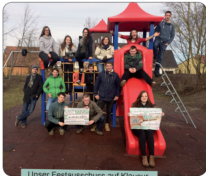
Unser Festausschuss auf Klausur