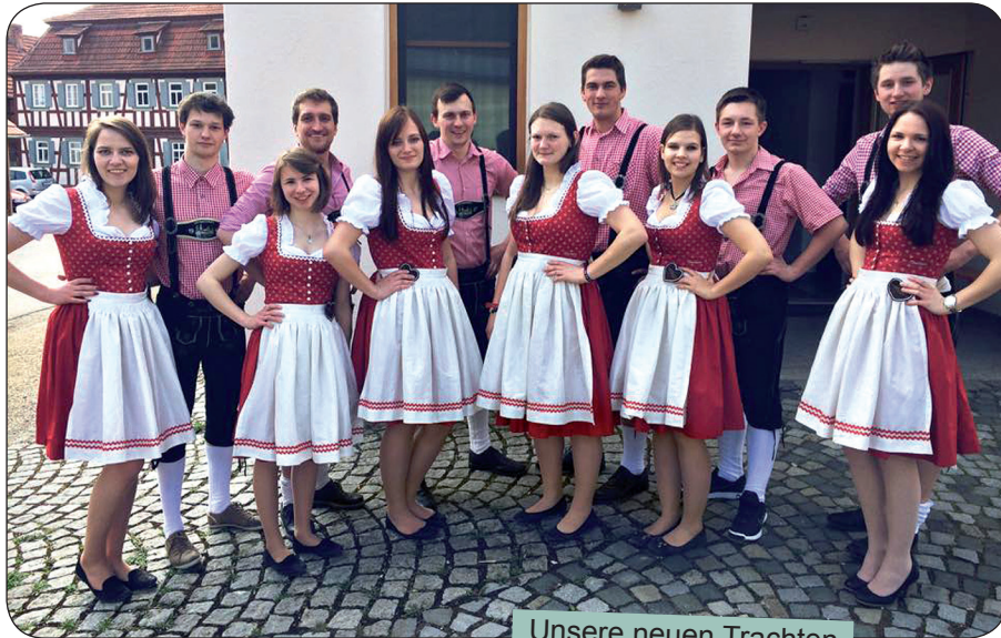
Unsere neuen Trachten

Als Verein haben wir eine Vorstandschaft. Diese wird zur Jahreshauptversammlung gewählt und besteht zurzeit aus neun Personen. Bei den Vorstandssitzungen wird ein monatliches Aktivitäten Programm erarbeitet, einzelne Veranstaltungen organisiert, Teams für Wettkämpfe zusammengestellt und wichtige Themen, die unsere Jugendarbeit betreffen, besprochen.