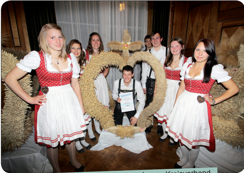
3. Platz beim Erntekronenwettbewerb vom Kreisverband