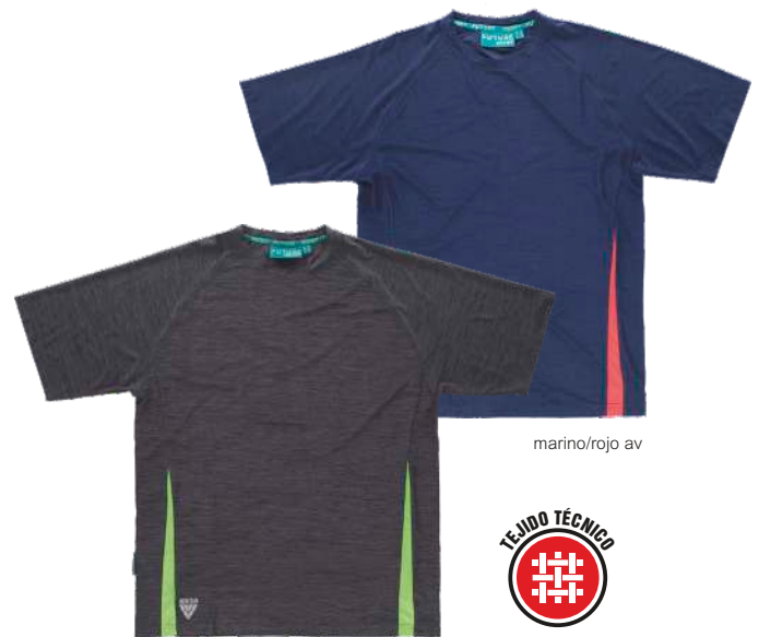
gris oscuro/verde lima