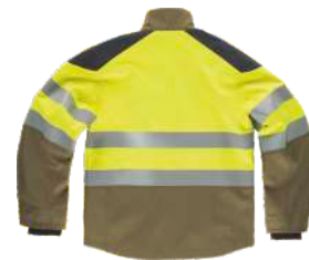
kaki/amarillo a.v./gris oscuro

Tejido: 75% Algodón 24% Poliéster 1% Fibra antiestática (220 g/m2)