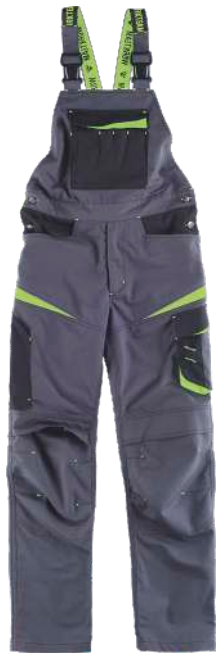
gris oscuro/negro/verde lima