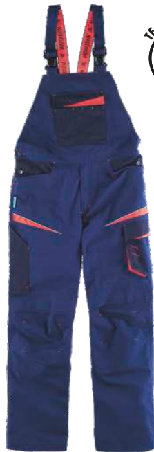
marino/marino oscuro/rojo a.v.