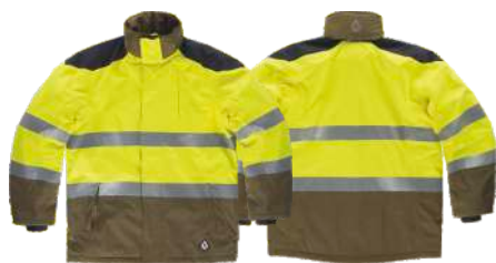
kaki/amarillo a.v./gris oscuro

Tejido: 75% Algodón 24% Poliéster 1% Fibra antiestática (270 g/m2)