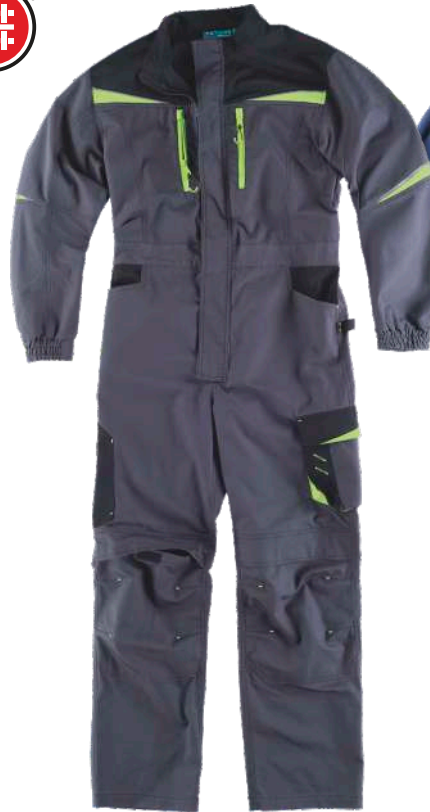
gris oscuro/negro/verde lima

Tejido: 65% Poliéster 35% Algodón (270 g/m 2 )