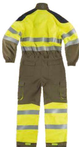
kaki/amarillo a.v./gris oscuro