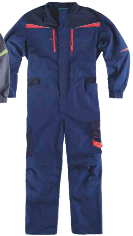
marino/marino oscuro/rojo a.v.