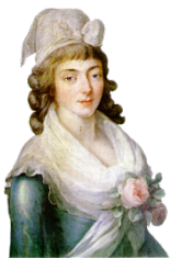
Manon Roland (1754-1793)

Fille d'un graveur, elle reçoit une éducation très poussée et épouse, en 1780, Jean-Marie Roland de La Platière, chef du futur parti girondin, qui devient Ministre de l'Intérieur en 1792. Soutenant la carrière de son mari, elle reçoit dans son salon les députés girondins. Elle est victime montagnarde et est exécutée le 8 novembre 1793.