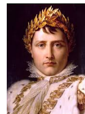
Napoléon Bonaparte (1769-1821)

Petit-fils de Louis XV, roi en 1774, il accepte de réunir les États généraux en 1789 mais se rallie difficilement à la monarchie constitutionnelle. Sa tentative de fuite et son attitude ambiguë face à la guerre accroissent son impopularité. Il est détrôné le 10 août 1792, jugé puis condamné et exécuté le 21 janvier 1793.