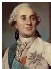
Louis XVI (1754-1793)

Fille d'un graveur, elle reçoit une éducation très poussée et épouse, en 1780, Jean-Marie Roland de La Platière, chef du futur parti girondin, qui devient Ministre de l'Intérieur en 1792. Soutenant la carrière de son mari, elle reçoit dans son salon les députés girondins. Elle est victime montagnarde et est exécutée le 8 novembre 1793.