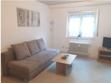
Wohnen-Schlafen Bild 1