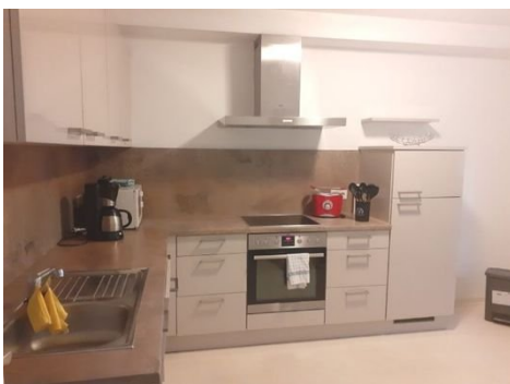
Küche Bild 1