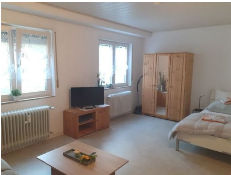
Wohnen-Schlafen Bild 3