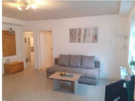
Wohnen-Schlafen Bild 2