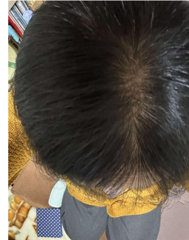
摂取前 → 摂取12週間後 摂取前 → 摂取12週間後