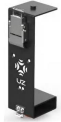
H100 (1 pcs)