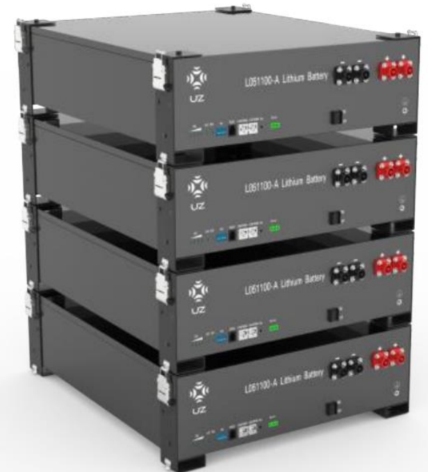
Bundle Installation Demo