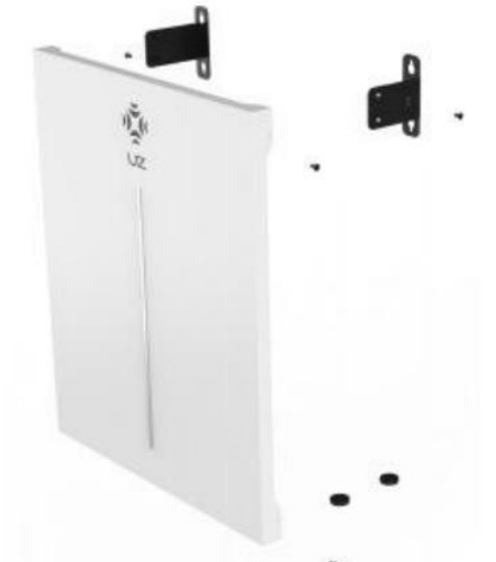
C100 (1 set)