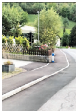
bis zur Oberdorfstrasse durch eine neue Leitung zu ersetzen.

Da deren Behebung nicht vorausseh- bzw. planbar und somit mit entsprechendem Aufwand und Kosten verbunden war (mehrheitlich Nacht- und Wochenendarbeiten), hat die Gemeinde beschlossen, die veraltete Leitung im Bereich der Abzweigung Chalchgasse