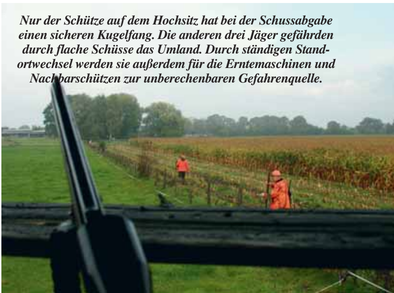
Nur der Schütze auf dem Hochsitz hat bei der Schussabgabe einen sicheren Kugelfang. Die anderen drei Jäger gefährden durch flache Schüsse das Umland. Durch ständigen Standortwechsel werden sie außerdem für die Erntemaschinen und Nachbarschützen zur unberechenbaren Gefahrenquelle.