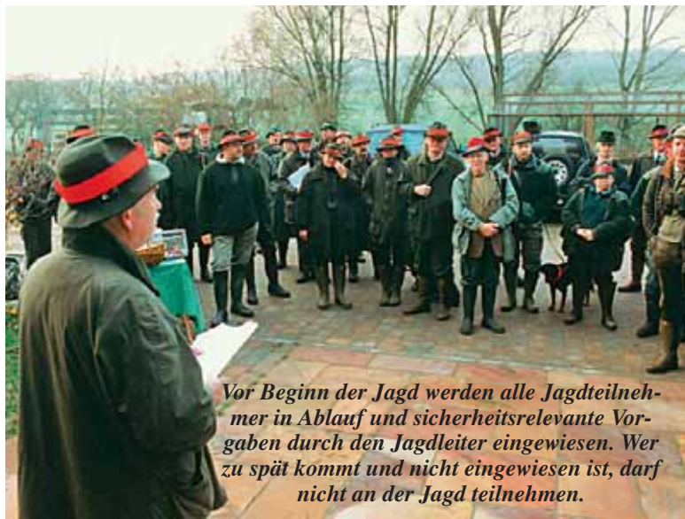
Vor Beginn der Jagd werden alle Jagdteilnehmer in Ablauf und sicherheitsrelevante Vorgaben durch den Jagdleiter eingewiesen. Wer zu spät kommt und nicht eingewiesen ist, darf nicht an der Jagd teilnehmen.

Da das Hutband auf weite Entfernung nicht erkennbar ist, tragen alle Treiber und alle Jäger zur besseren Wahrnehmung eine signalfarbene Jacke oder Weste.