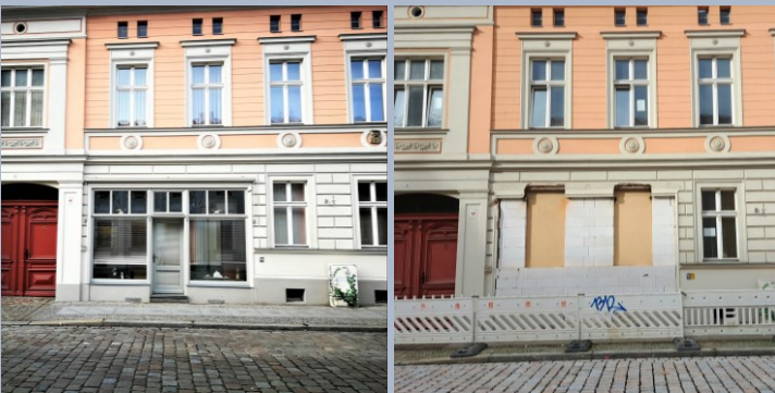
Plauer Straße 15