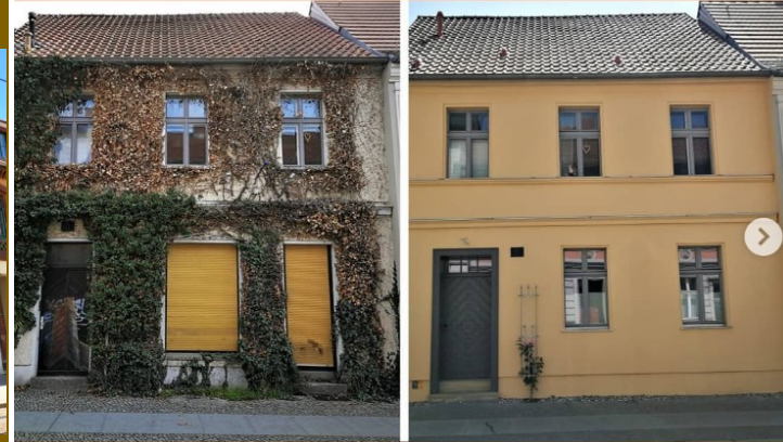
Plauer Straße 9