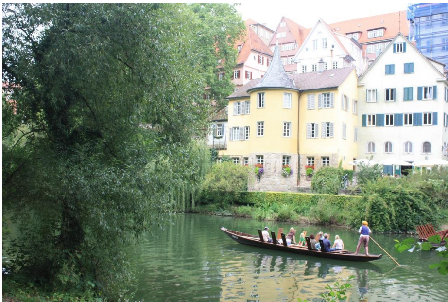
„Stocherkahn“ vor dem Hölderlinturm in Tübingen

So liegt es nahe, sich auf den Weg ins Baden-Württembergische zu machen, um einen tieferen Einblick in das faszinierende Geistesleben unserer Nachbarn zu bekommen. Dabei geht die erste von drei geplanten Touren in die schwäbische Literaturlandschaft vom Startpunkt Nürnberg über Weinsberg, Brackenheim, Marbach und Ludwigsburg in die viel gepriesene Universitätsstadt Tübingen. Hier werden Sie vier Tage lang in einem angenehmen Hotel logieren und von hier aus einige faszinierende Abstecher in die dichteste Literaturlandschaft unseres Kontinents unternehmen.