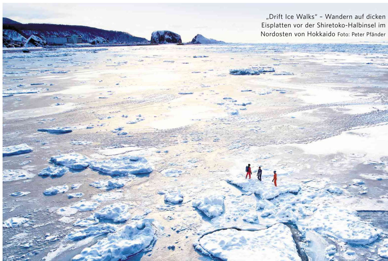
„Drift Ice Walks“ – Wandern auf dicken Eisplatten vor der Shiretoko-Halbinsel im Nordosten von Hokkaido

Die Felseninsel bezirzt mit Geschichte, Kirchen und Stränden Seite m 14