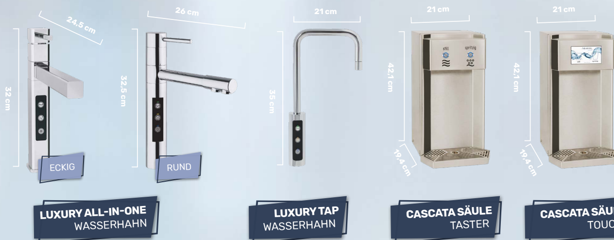
LUXURY ALL-IN-ONE WASSERHAHN