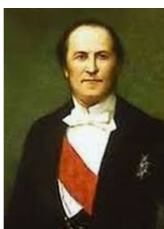
Georges Haussmann (1809-1891)

Haut fonctionnaire, il est renvoyé sous la Deuxième République avant d'être réintégré sous le Second Empire. Il est nommé préfet de la Seine en 1853 et est chargé de mener des travaux pour réaménager la capitale. Il est fait baron en 1857. Il est renvoyé par Émile Ollivier en 1870 et fait l'objet de nombreuses critiques les républicains.