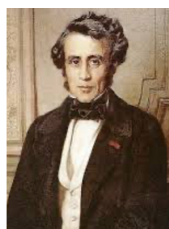
Émile Pereire (1800-1875)

Haut fonctionnaire, il est renvoyé sous la Deuxième République avant d'être réintégré sous le Second Empire. Il est nommé préfet de la Seine en 1853 et est chargé de mener des travaux pour réaménager la capitale. Il est fait baron en 1857. Il est renvoyé par Émile Ollivier en 1870 et fait l'objet de nombreuses critiques les républicains.