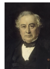
Isaac Pereire (1806-1880)

Fils d'un couple de bourgeois juifs bordelais, il monte à Paris en 1833 et devient couturier d'affaires. Dès 1835, il obtient avec son frère Isaac la concession de plusieurs lignes de chemin de fer. Il fonde aussi le Crédit mobilier en 1857 qui finance en partie les travaux du baron Haussmann à Paris et il élu député en 1863. En 1869, il ne se représente pas.