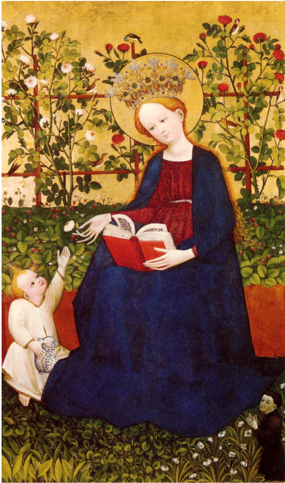
Madonna mit Erdbeeren, unbekannter Meister, Köln, 1450