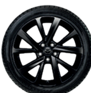
Mazda MX-30 18" (Black Glossy) Ab 06/2020* Reifen: 215/55 R18