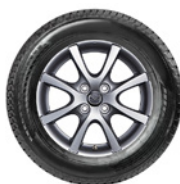
Mazda6 17" (Titanium Grey) Ab 11/2012* Reifen: 225/55 R17