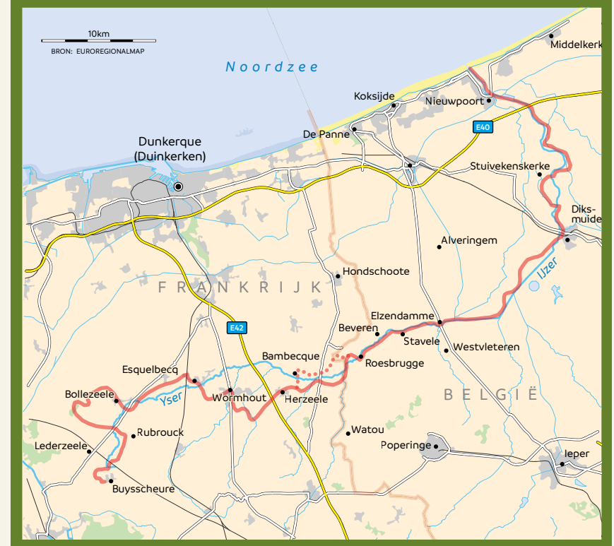
Figuur 1: Wandelroute langs de IJzer