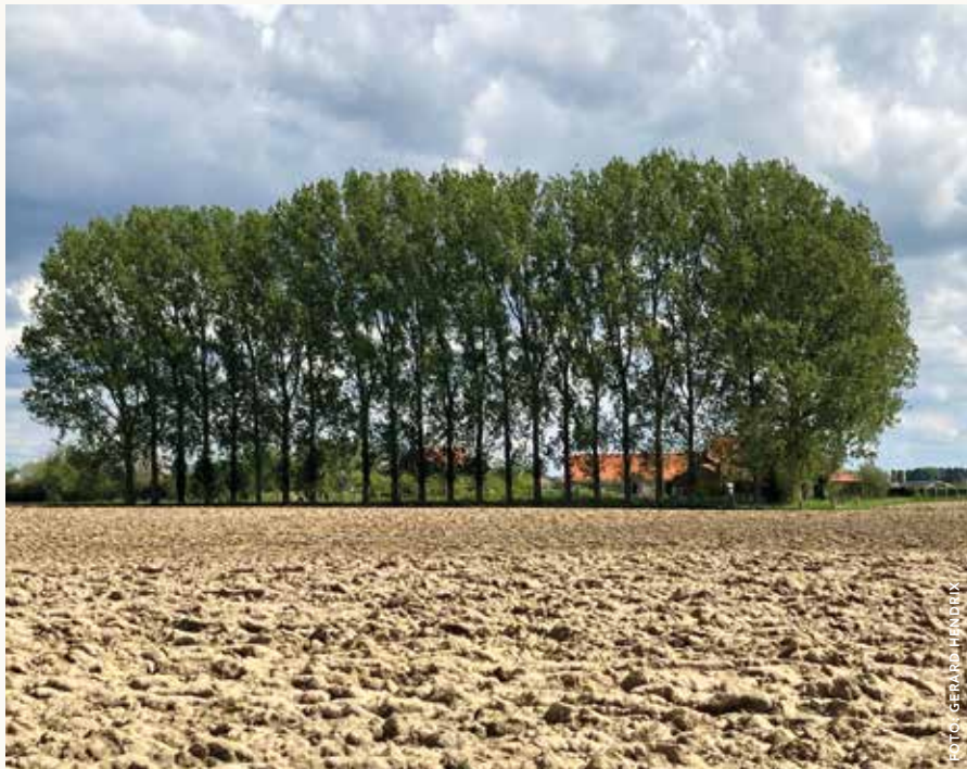
Aan de Vlaamse kant neemt de akkerbouw steeds meer toe. Grasland wordt omgezet in akkers voor bieten, graan en aardappelen.

bruggen en de natuur. Het lijkt nog één grote vloeiveide met termen als geleed, koegracht, vaartje, laantje, trekgracht en beek. Dat is het oude systeem, nog te zien als je goed kijkt, tussen Diksmuide en Roesbrugge. Daarvoor en daarna heeft het nieuwe landschap het overgenomen.