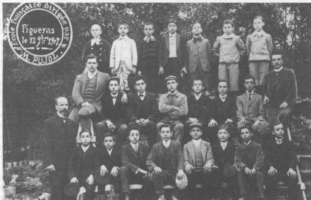
En la Escuela Francesa de Figueras (último de la derecha, abajo)