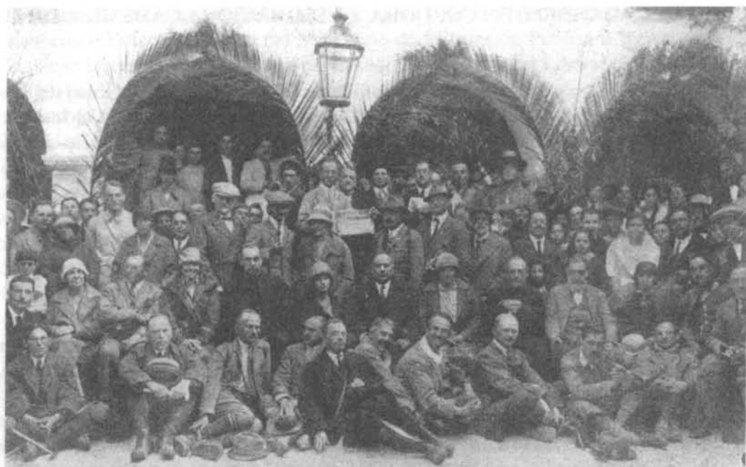
Los integrantes de la Excursión del XIV Congreso Geológico Internacional en el patio del Santuario de Cabra

en el que viene a resumir la vida de su padre como hombre, como maestro, educador, folklorista, cartógrafo, deportista y organizador.