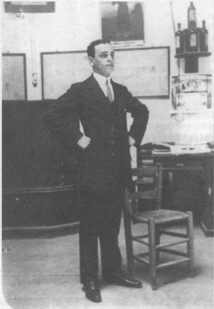
1917: Carandell oposita a la cátedra de Historia Natural Fisiología e Higiene del Instituto de Cabra (Córdoba)

ya tiene publicados, declarando, por otra parte, “poseer con la expedición suficiente la lengua francesa ade-