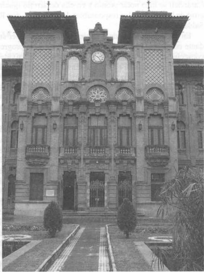
Fachada del edificio que fue Escuela y Facultad de Veterinaria de Córdoba

El periódico republicano de Córdoba AGORA en la sección de "Rumores" llegó a decir el 19 de octubre de 1935: