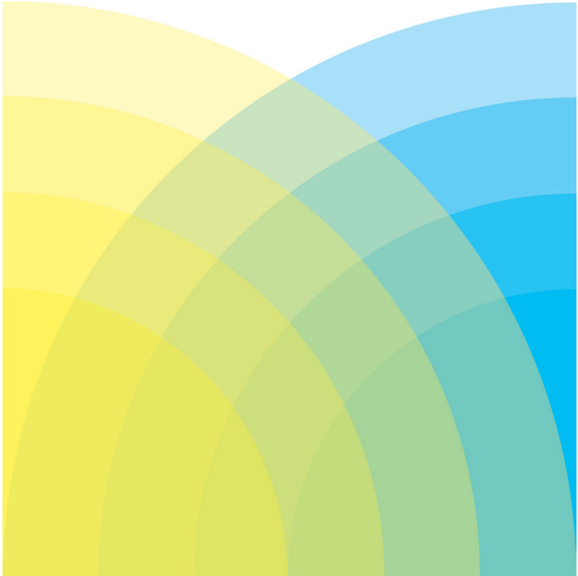
SUSANNE PERTIET, FLÜGELTÜREN, 2023