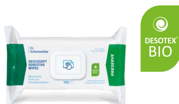
DESCOCEPT SENSITIVE WIPES