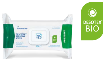
DESCOCEPT SENSITIVE WIPES