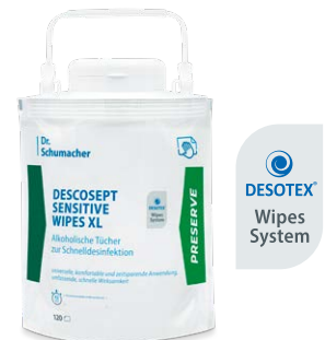
DESCOCEPT SENSITIVE WIPES XL