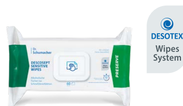
DESCOCEPT SENSITIVE WIPES