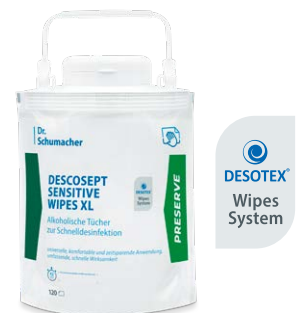
DESCOCEPT SENSITIVE WIPES XL

DESCOCEPT SENSITIVE WIPES sind alkoholische, gebrauchsfertige Tücher zur materialschonenden Desinfektion und Reinigung von Medizinprodukten, medizinischem Inventar sowie Flächen aller Art in patientennahen Bereichen.