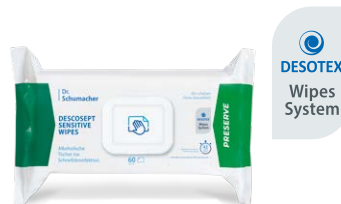
DESCOCEPT SENSITIVE WIPES