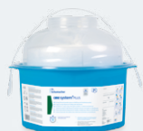
ONE SYSTEM+ PLUS